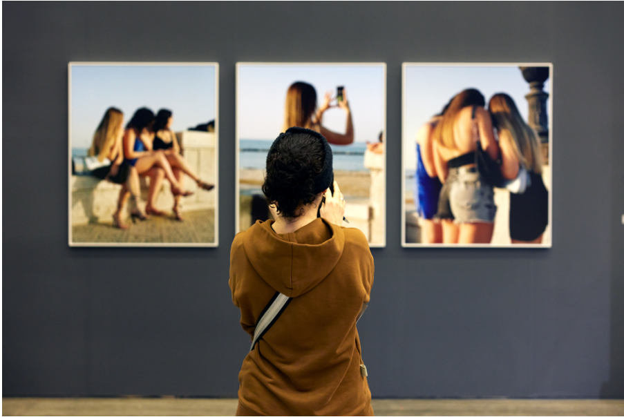
Prospects 2023.