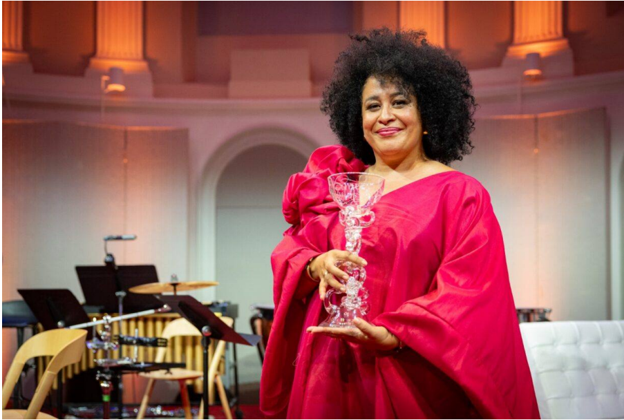
Tania Kross wint Johannes Vermeer Prijs 2023.