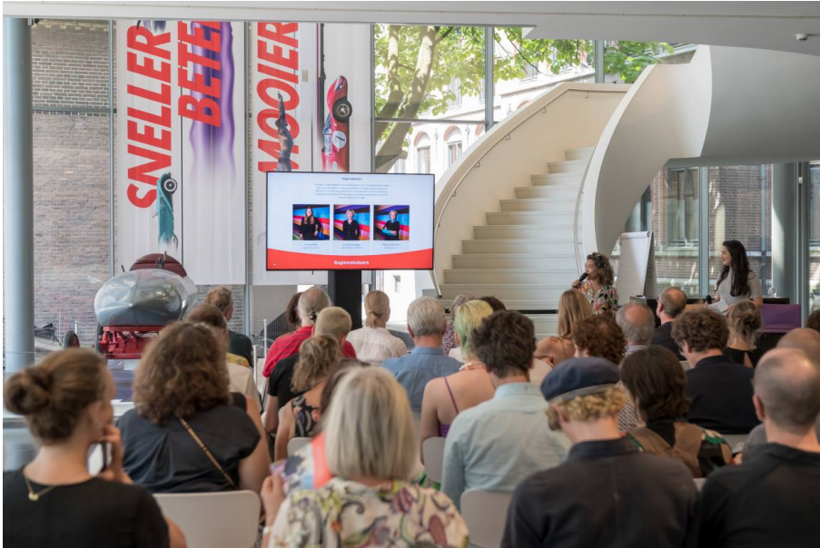
Mondriaan Fonds on tour in 's-Hertogenbosch

Het doel van de tour was meerledig. Enerzijds informatie ophalen: wat speelt er in het lokale beeldende kunst- en erfgoedveld? Wat moet het Mondriaan Fonds aan de vergadertafel meewegen als het gaat om deze provincie? Wat missen de makers, instellingen en beleidsmakers om hun plannen mogelijk te kunnen maken? Hoe kan het Mondriaan Fonds aan die behoeften bijdragen? Een gesprek over de noden en mogelijkheden per provincie. Anderzijds deelden we informatie: wat doet het Mondriaan Fonds voor het beeldende kunst- en erfgoedveld en hoe komt ons beleid tot stand? Wat er gebeurt met je aanvraag zodra je deze hebt ingediend en wie beoordeelt deze eigenlijk? Tijdens beknopte thema-sessies informeerden we de aanwezigen in kleinere groepen rondom de volgende vragen: Voor het eerst een aanvraag schrijven, hoe pak je dat aan? De codes toepassen: wat moet wel en wat hoeft niet? Regelingen voor kunstenaars /instellingen: wat kunnen wij voor jou betekenen? Deel jouw kennis: vertel het Mondriaan Fonds wat er speelt in jouw regio.