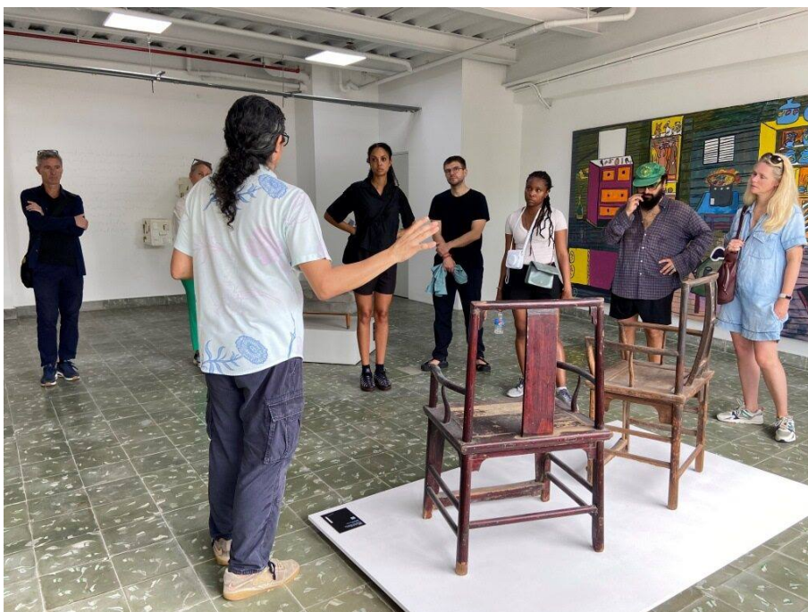
Casa Sola, Panama City